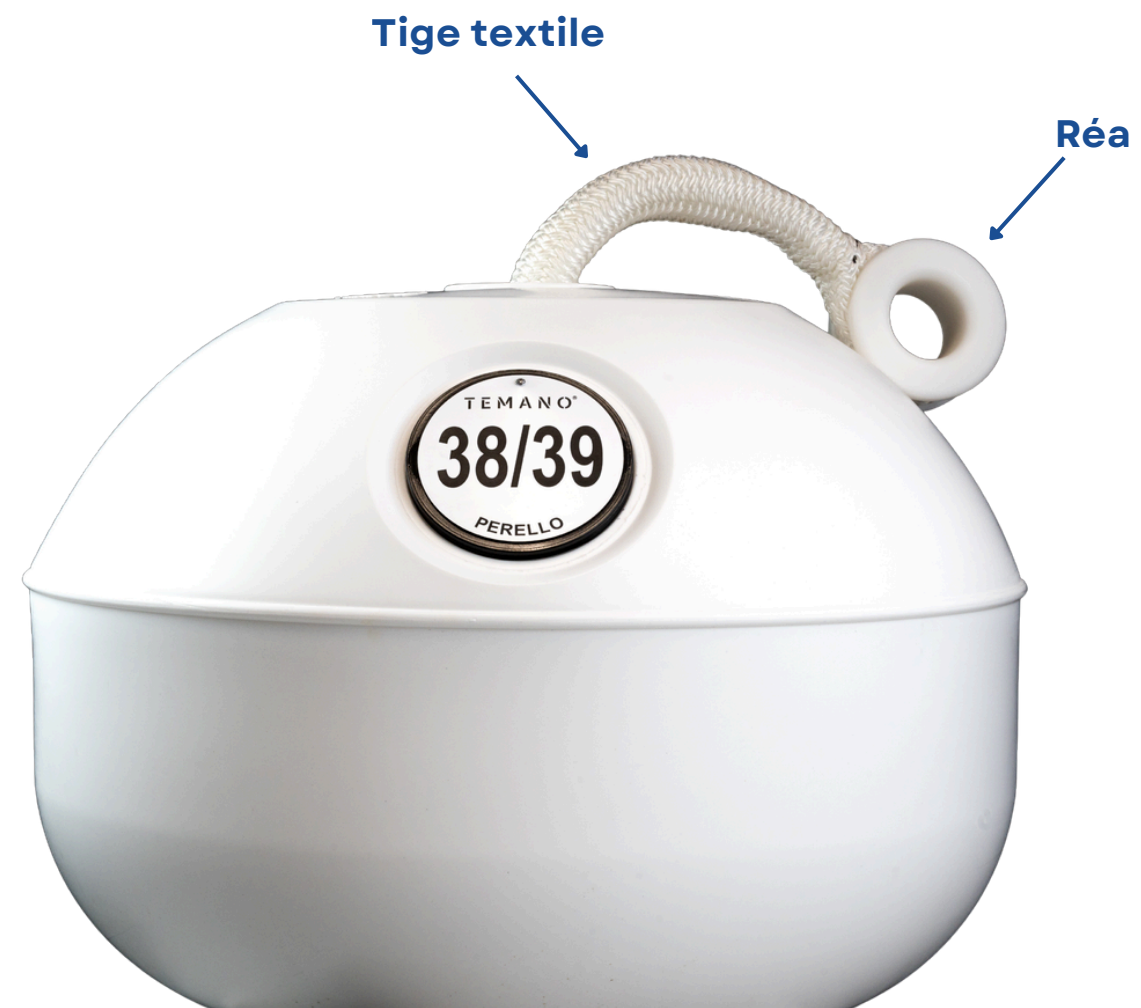
Bouée Temano® 150L